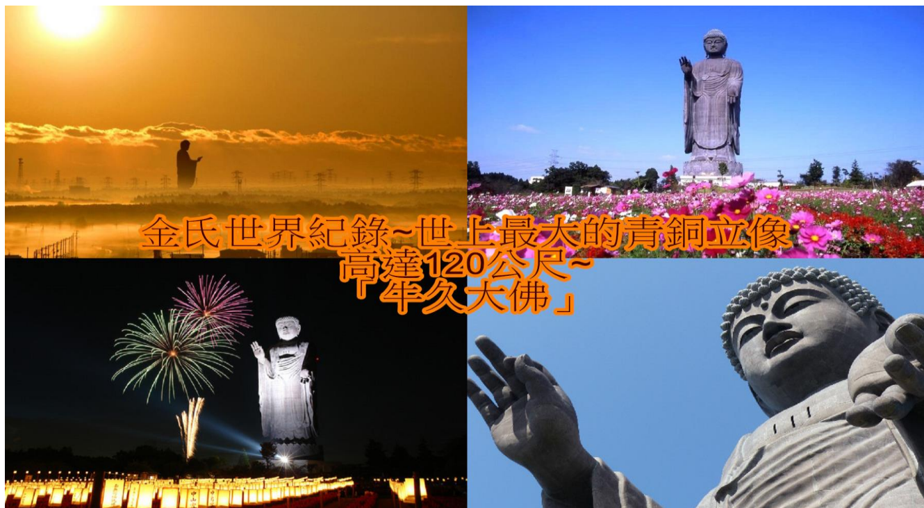
金氏世界紀錄~世上最大的青銅立像 高達120公尺~ 「牛久大佛」