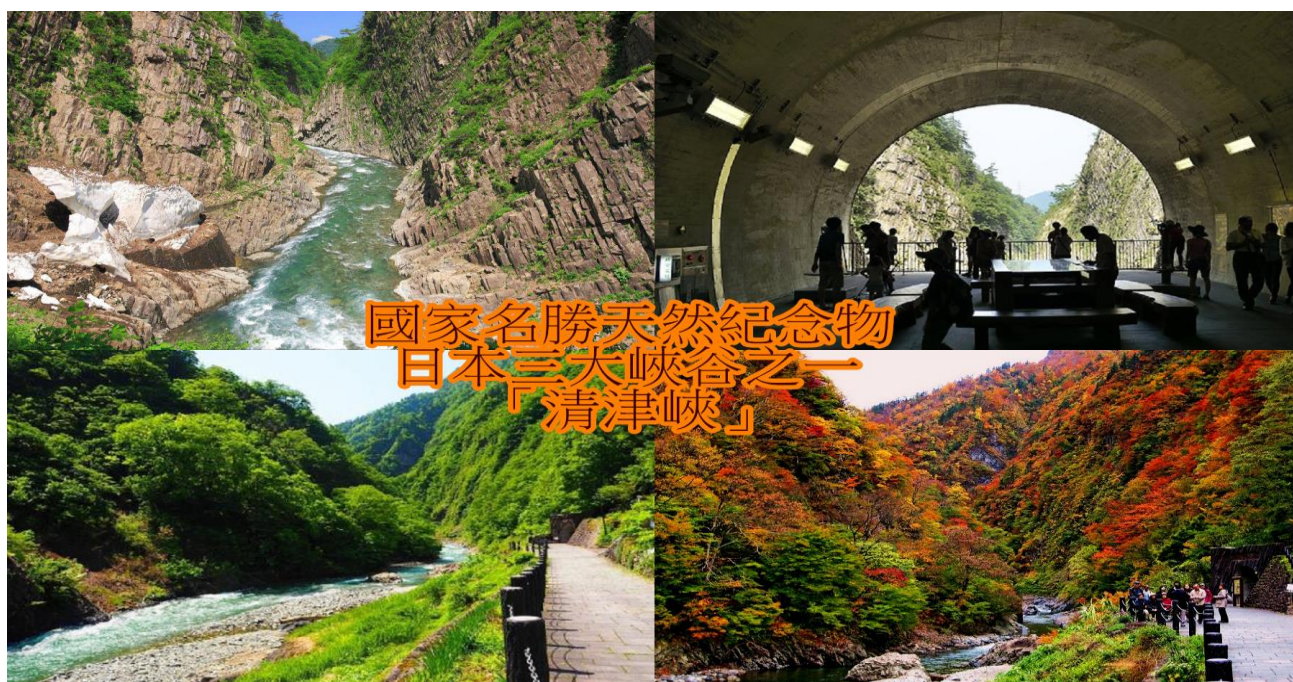
國家名勝天然紀念物 日本三大峽谷之一 「清津峽」

全球最高的青銅大佛在日本，但你知道祂「來自台灣」嗎？許多人飛往成田機場途中，降落前望向窗外，或許曾被一尊聳立田野間的灰色大佛像吸引，發現祂一如彰化八卦山大佛般俯視眾生。這尊大佛正是日本第一、全世界最高的青銅佛像「牛久大佛」，坐落在茨城縣牛久市，20多年來總是慈悲地望向南方。如此吸睛不是沒有原因，牛久大佛整體高度為120公尺，霸氣高度獲得金氏世界紀錄認證。1983年日方有意興建一座日本最大的佛像，展開籌畫設計，跨海找來台灣聖光雕塑公司合力圓夢，先在台灣以青銅打造每個部位零件，再漂洋過海運到日本組裝，耗時10年，終於在1993年1月落成！這尊台灣製造的「牛久大佛」自此躍身日本第一的大佛像，連美國自由女神像也只有祂的三分之一大小。